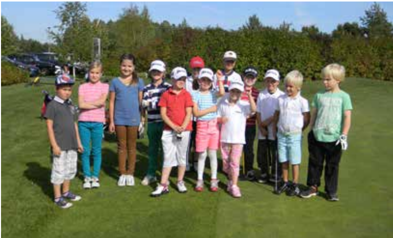
Kuva Uusia junnuja tulikokeessa greencardin suorituksessa.