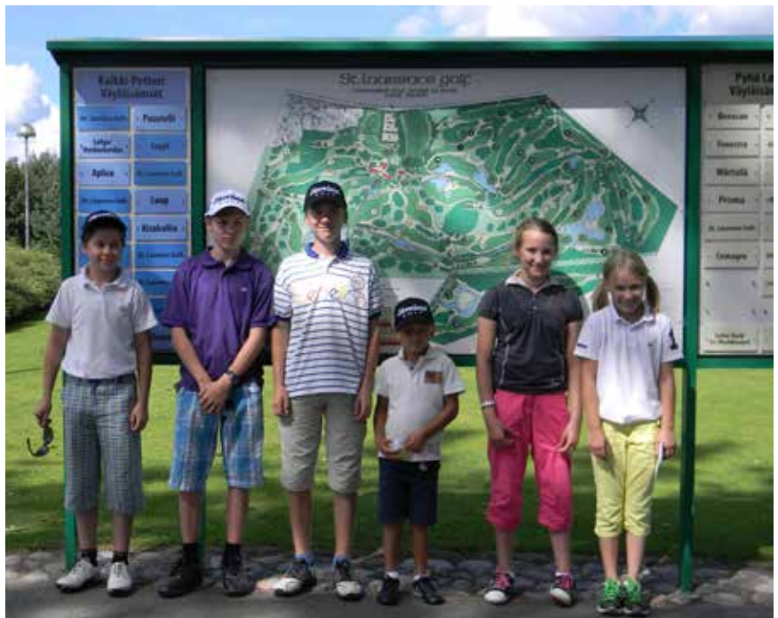
Kuva Par3 ryhmäkuva elokuussa.