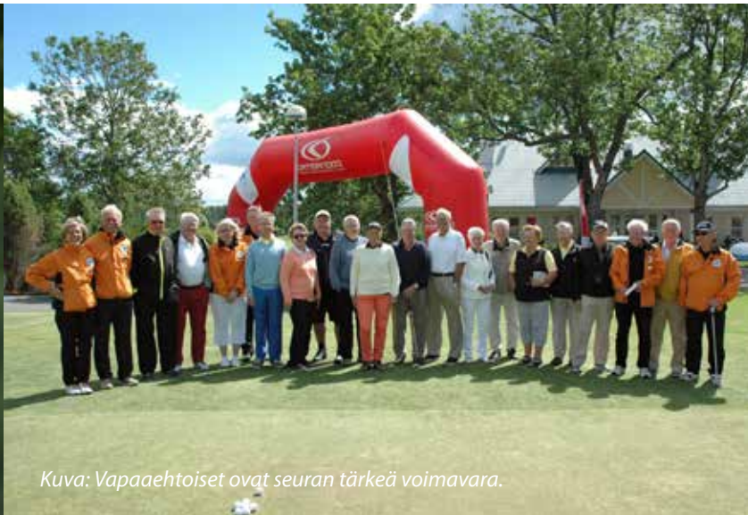
Kuva: Vapaaehtoiset ovat seuran tärkeä voimavara.