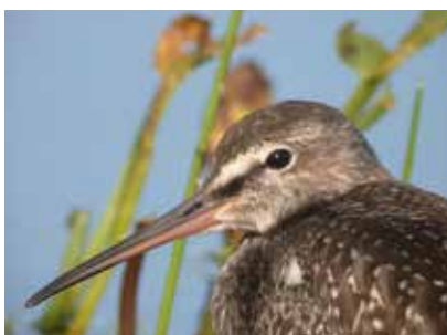
Kuva Nuori mustaviklo on pysähty- nyt kentälle syysmuuttomatallaan elokuussa.