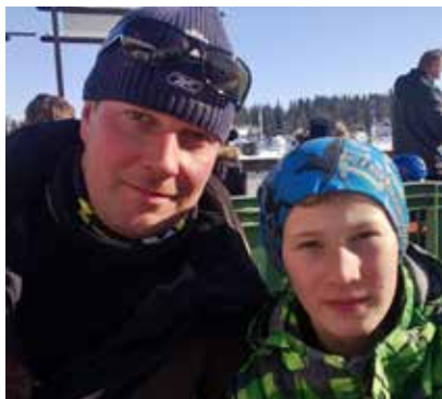
Kuva Teron (vas.) tavoitteena on pelata aina paremmin kuin edellisellä kierroksella. Miskan ennätys oli 90 lyöntiä keltaisilta Pyhällä Laurilla.

Miksi juuri St. Laurence Golf on se oikea paikka pelata golfia?