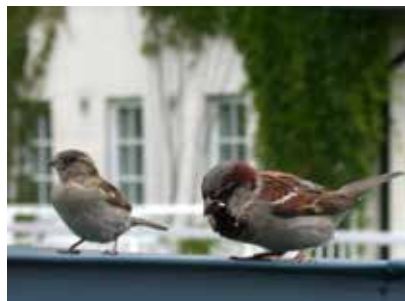
Kuva Tavallinen varpunen (kuvassa) oli tavallinen näky kentällä vielä kym- menen vuotta sitten. Nyt tilalla ovat pikkuvarpuset.