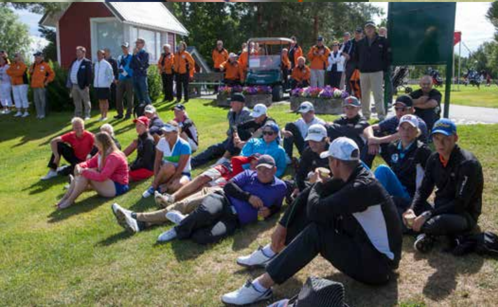
Kuva Iloista yleisöä Lohjalla.