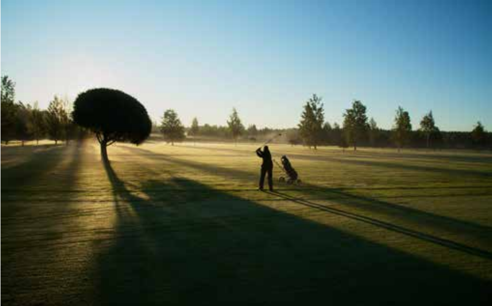
Kuva Mikko Huplin hieno otos syysvalossa Kalkki-Petteriltä. Tämän lehden kansikuva on myös hänen ottamansa.