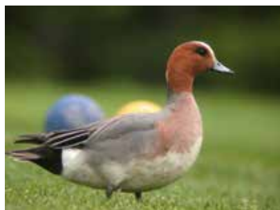
Kuva Haapanakoiras poseeraa väylän alussa.