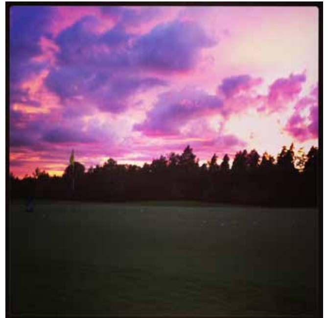
Kuva Yllä Teemu Tolppalan kuvaama hieno iltarusko harjoitusten lomassa.