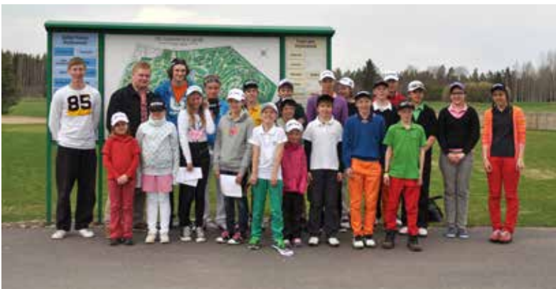
Kuva Ryhmäkuva kauden avauksesta keväällä.