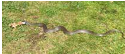
Kuva: Kyy pisti sammakkoa poskeensa Pyhällä Laurilla viime kesänä.