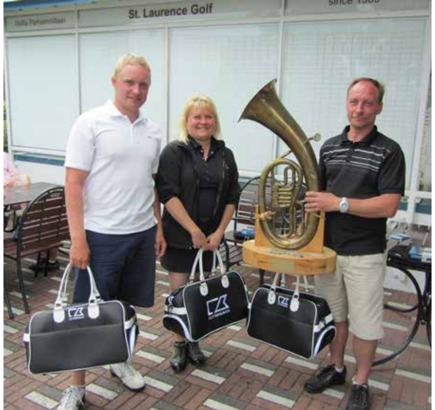
Kuva: Jazz Golfin voittajat Mörskyt.