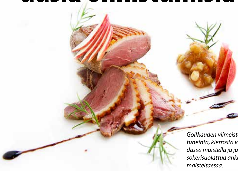
Golfkauden viimeistä, tai onnistuneinta, kierrosta voi Joulupöydässä muistella ja juhlistaa kuvan sokerisuolattua ankanrintaa maisteltaessa.

kootaan yhteen ja katseet käännetään kohti seuraavan kauden avauksia.