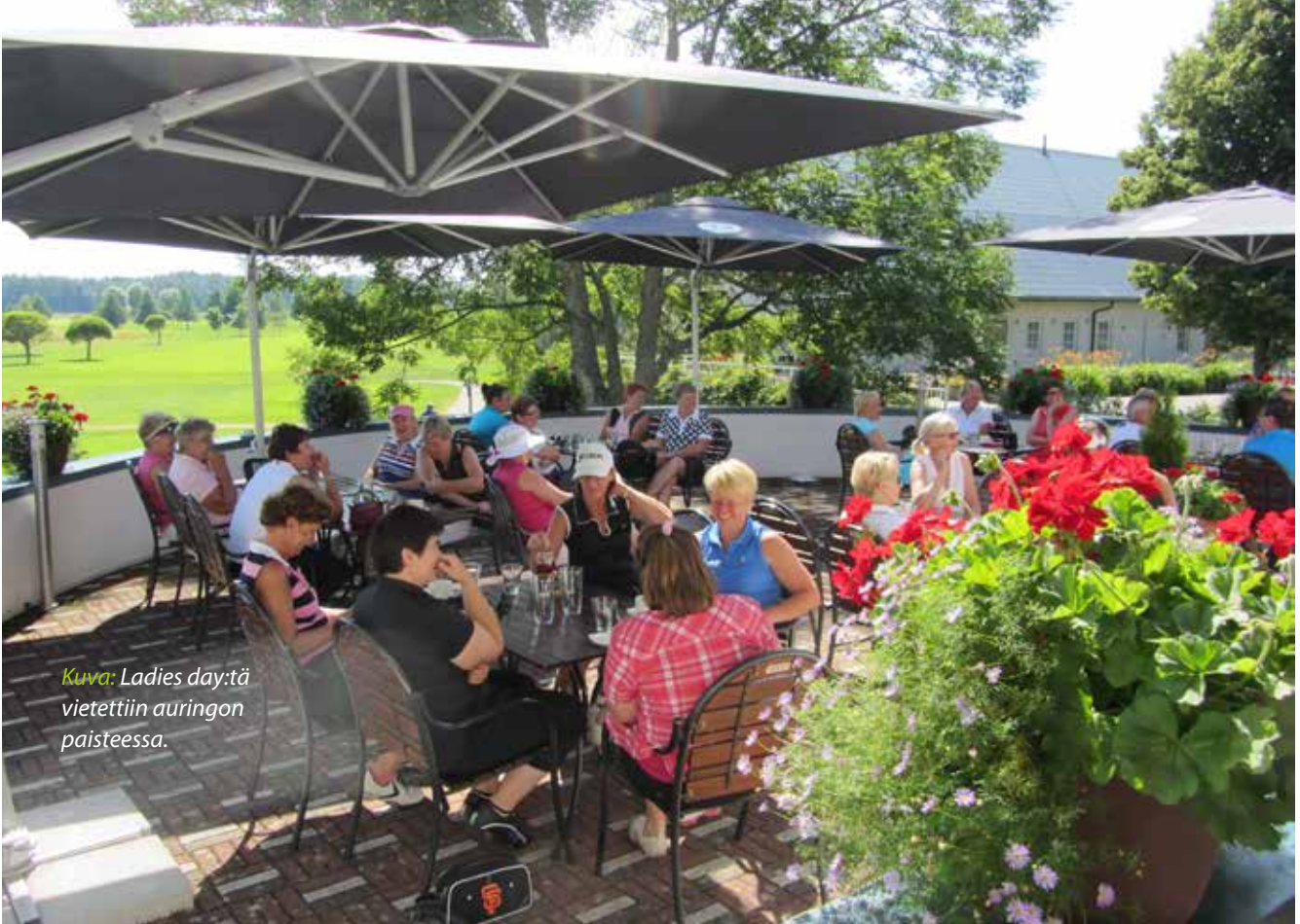
Kuva: Ladies day:tä vietettiin auringon paisteessa.