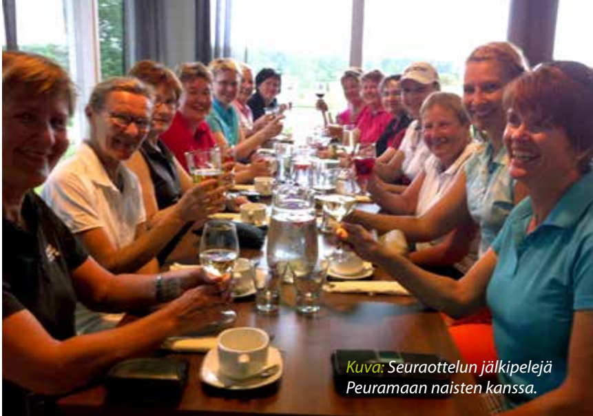
Kuva: Seuraottelun jälkipelejä Peuramaan naisten kanssa.