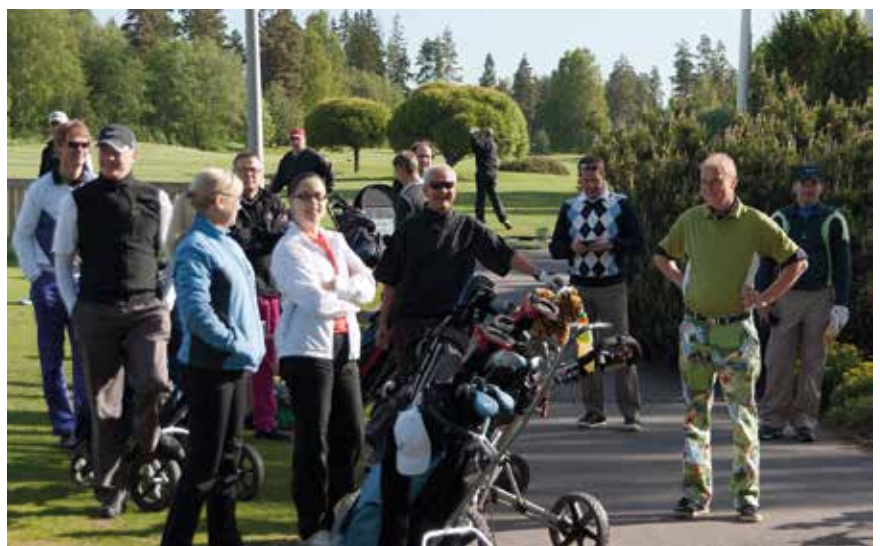
Kuva: Innokkaat pelaajat odottelemassa kisastarttia.