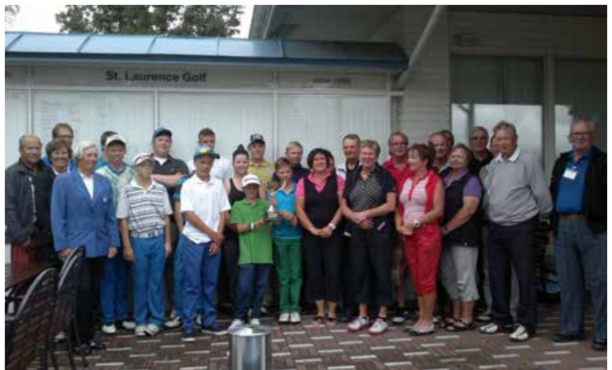
Kuva: Toisen kerran pelatun Ryder Cupin voitti juniorit ja seniorit joutuivat tiukassa ottelussa taipumaan.

Seuran sisäisissä kilpailuissa jatkoimme maanantaisia treffejä. Treffeillä kävi 42 henkilöä, jotka tekivät yhteensä 137 pelisuoritusta. Pelaajamäärässä oli hiukan kasvua edellisiin vuosiin verrattuna. Uutena kilpailuna oli senioreiden viikkokisa. Osallistujamäärässä ei päästy aivan tavoitteeseen, mutta onnistunut finaali osoitti, että viikkokisa tulee olemaan myös tulevien vuosien kilpailukalenterissa. 41 pelaaja teki 135 pelisuoritusta kesän aikana. Koko kesän kestänyt kuu-kausikilpailu ei tänä vuonna kiinnostanut pelaajia aikaisempien vuosien tavoin.