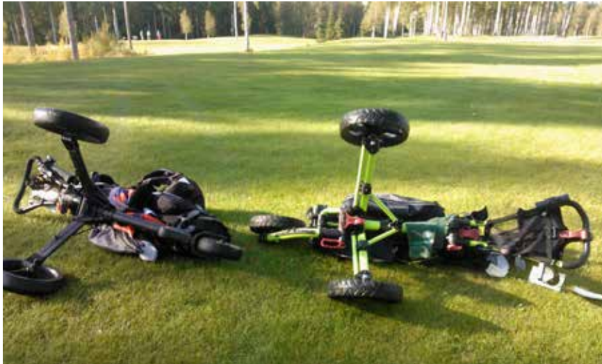
Kuva: Kärrykolari Keimolan vierailulla. Naurua riitti pitkään ja vahingoilta vältyttiin.