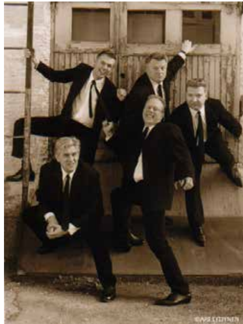
Lumottu Maa soittaa tanssittavaa rautalanka ja beat -musiikkia 60-luvun hengessä, joten bändin täytyy myös näyttää siltä.