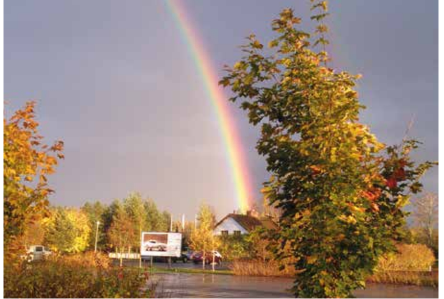
Kuva: Löytyykö pelitoimistosta aarre?