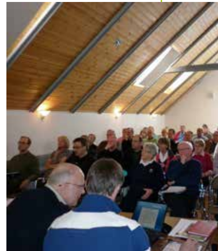
Kuva: Seuran syyskokoukseen voi ilmoittautua Nexgolfin kautta.