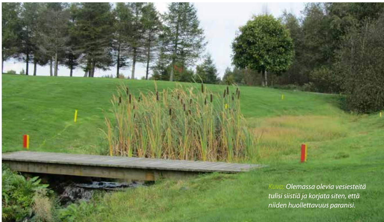
Kuva: Olemassa olevia vesiesteitä tulisi siistiä ja korjata siten, että niiden huollettavuus paranisi.

uudistetun Kalkki-Petterin viheriön 9 ja muiden viheriöiden nurmipintojen välillä.