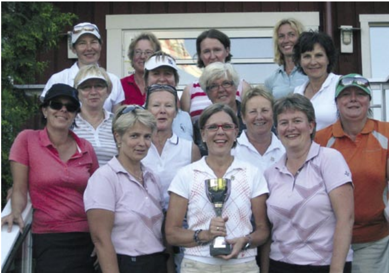
Lohjan Ladyt voittivat Peuramaan seuraottelussa.