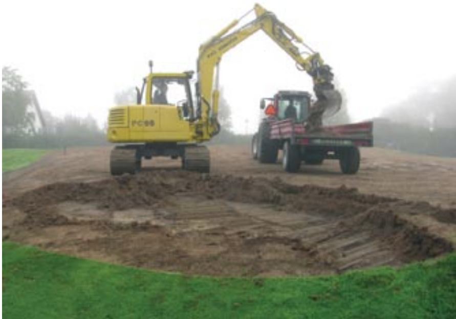
Kalkki-Petterin 9. viheriön remonti alkamassa

Pelikauden 2011 lähestyessä päätöstä, haluamme selvittää muutamia kentänhoidon asioita.