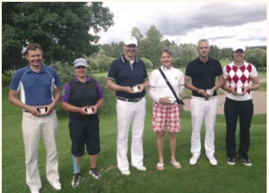
Midien SM mitalistit yhteiskuvassa (pronssi-kulta-hopea alk. vas)