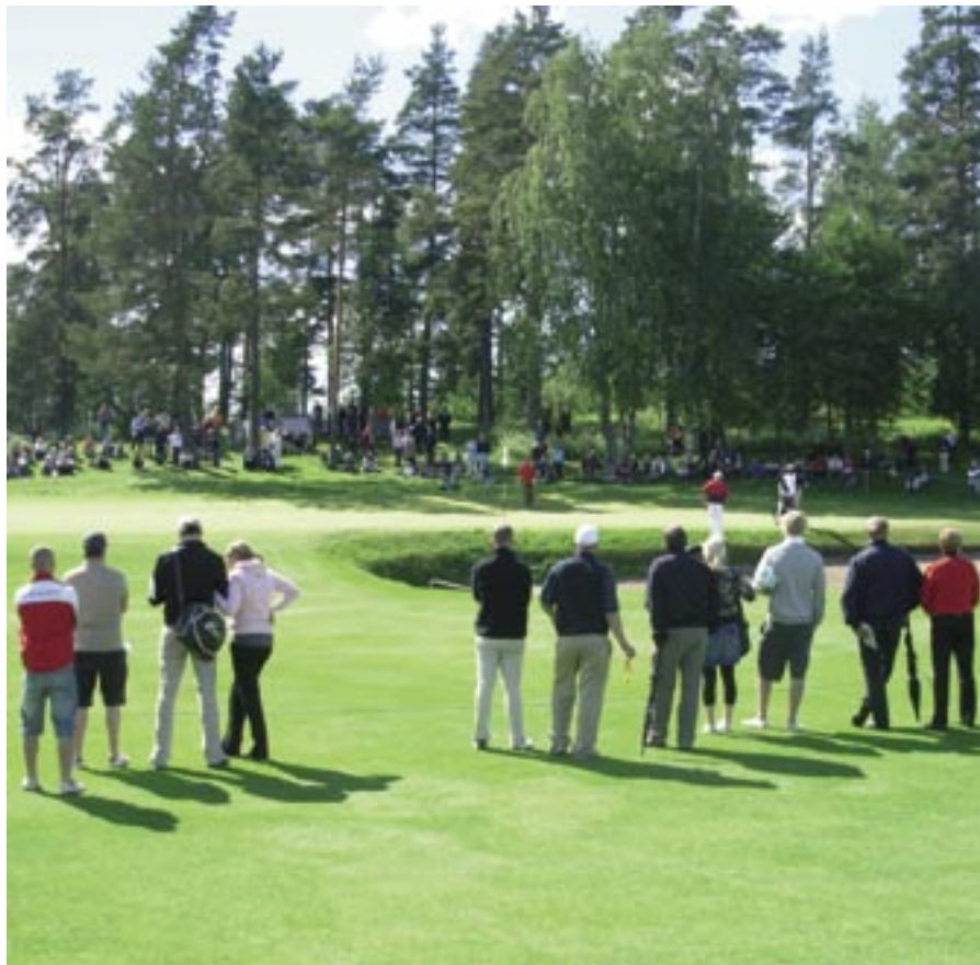
SK Challenge 2008 toi Lohjalle Mikko Ilosen myötä paljon myös katsojia. Nyt Challenge Tour on taas palaamassa Suomeen vuosiksi 2012-2014. Onko Lohja mukana?

St. Laurence Golfin slogan (suomeksi iskulause) on ollut sitten vuoden 2003–2004 strategian laadinnan, Golfia Parhaimmillaan. Sen eteen on tehty töitä, pienissä ja hieman isommissakin asioissa, ja työ jatkuu.