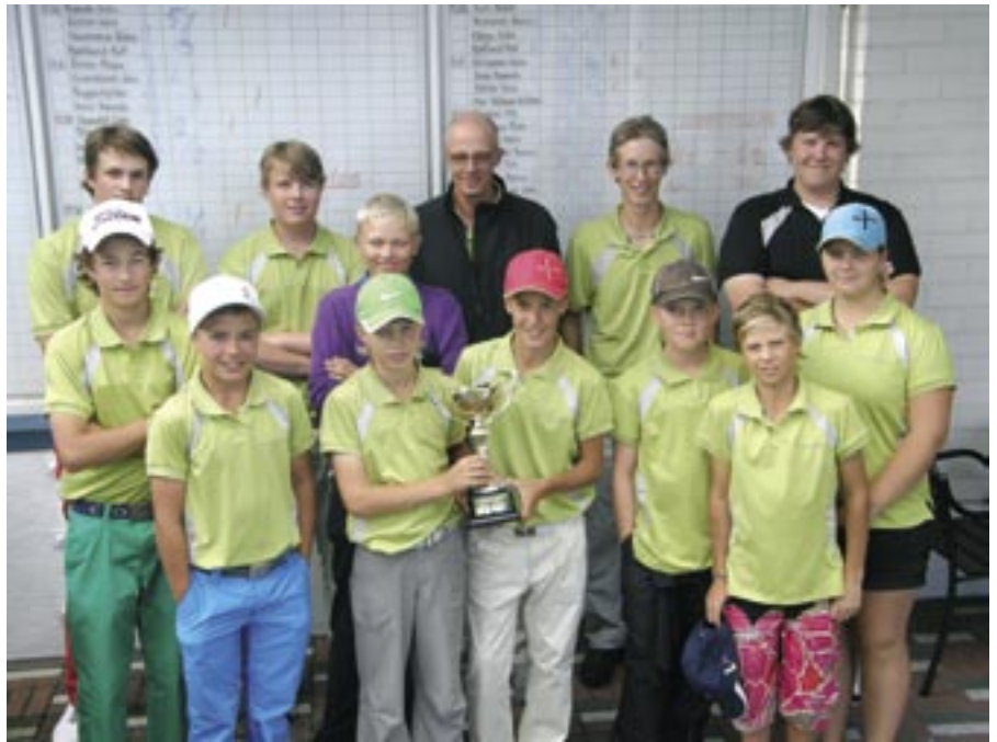
Junioreiden joukkue voitti Ryder Cup haasteottelun senioreita vastaan. Hauska uusi perinnekilpailu kirjattiin junnuille luvuin 11,5-6,5. Ensi vuonna taas!

Uudenmaan piirin reikäpeleihin osallistuimme ja 4-välierissä Helsingin Golfklubin kanssa