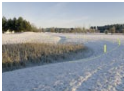
Kalkkiksen 1-väylän lampi on entistä suurempi.

Syksyn ja talven aikana Kalkki-Petterin väylille 2, 13, 15 tehtiin uudet back-teet, jotta kenttää pystyttäisiin kehittämään ajan haasteisiin. Lyöntipaikkojen rakentamisessa hyödynnettiin bunkkereista poistettu kivinen hiekka, joka sopii erinomaisesti lyöntipaikan pohjamateriaaliksi. Keväällä uusille lyöntipaikoille ajetaan kasvualusta sekä asennetaan siirtonurmi. Lyöntipaikat on tarkoitus ottaa käyttöön viimeistään heinäkuussa Junioreiden SM-kisoissa.