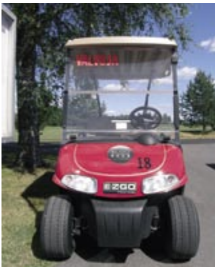
Ruuhkaisimpina aikoina kentän toimintaa kontrolloi golfautolla liikkuva valvoja.

Jokaisella pelaajalla tulee olla omat pelivarusteet (bägi, mailat, pallot, tiit, griinihaarukka, merkkausnastat, jne) mukana kentällä (huom! myös par 3:lla).