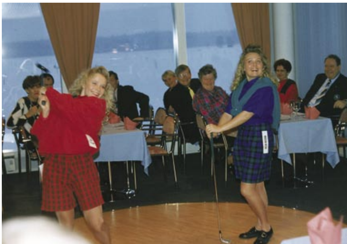
Myös muotinäytökset ovat olleet osa Klubin aktiivista toimintaa.