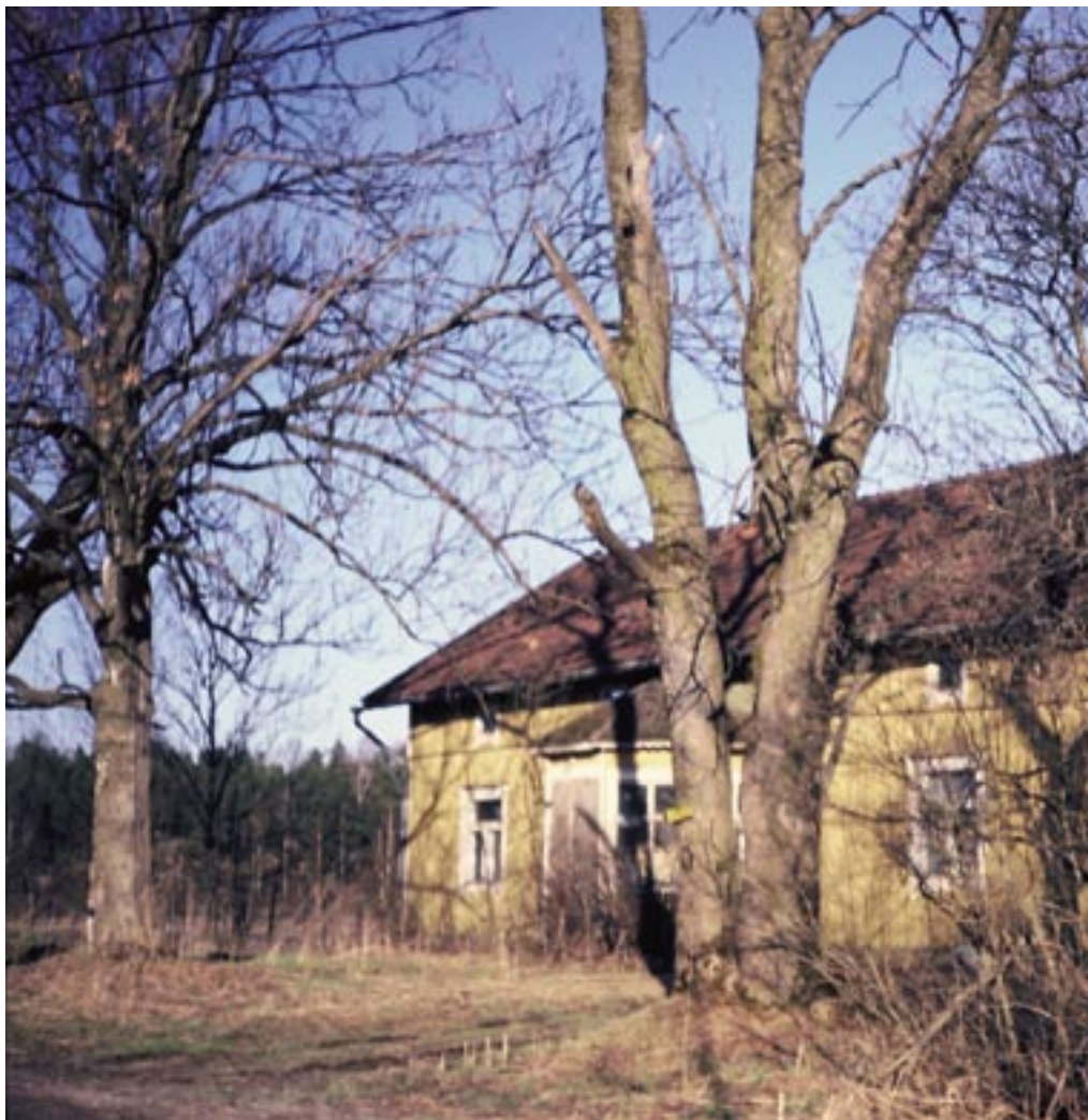
”Pehtorin talo” oli täsmälleen Klubirakennuksemme nykyisellä paikalla.