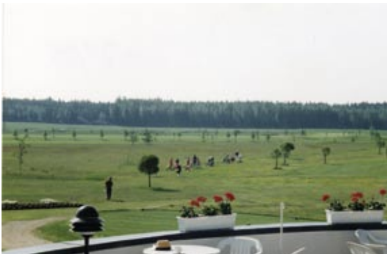
Kalkki-Petterin luonne on ajan saatossa muuttunut "peltokentästä" tyylikkääksi puistokentäksi.

St. Laurence Golfin oma klubihenki on rakennettu vuosien varrella yhteisten kilpailujen ja tapahtumien muodossa. Ensimmäisellä tasoituslistalla 18.8.1989 oli 9 nimeä, nyt jäsenrekisterissämme on yli 1750 jäsentä! Ei siis ihme, että ajan saatossa myös tapahtumat klubilla ovat muuttaneet luonnettaan. Meillä on kuitenkin hyvät mahdollisuudet rakentaa ja ylläpitää omaa golfkulttuuriamme hyvän klubihengen varaan myös jatkossa.