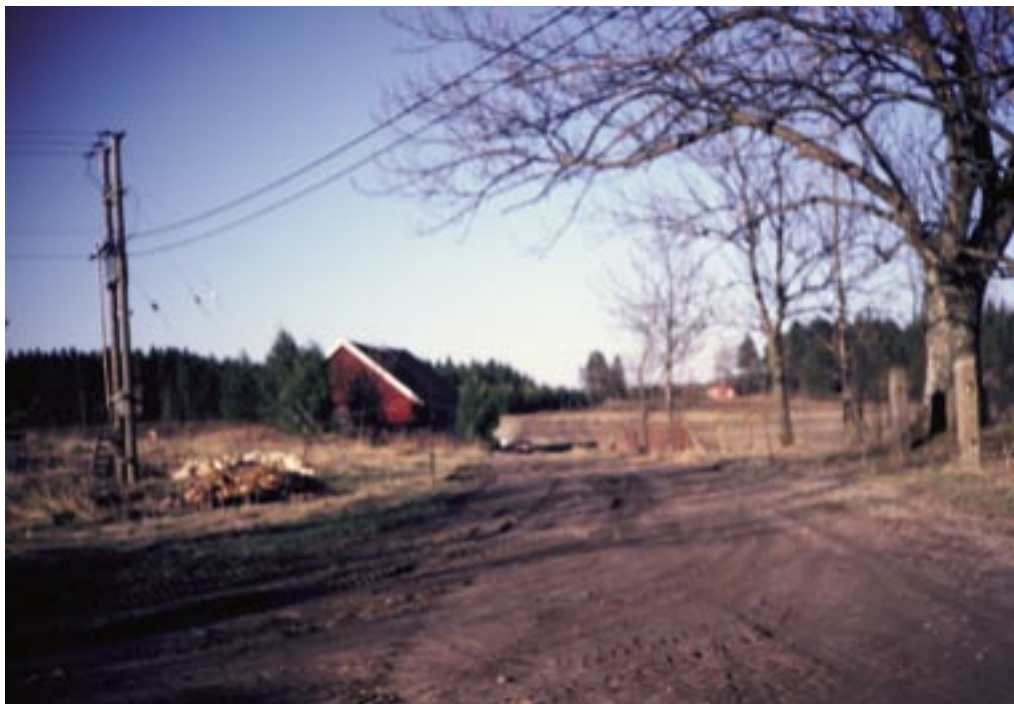
Alkuperäismaisemaa Klubin edestä kohti Kalkki-Petterin ja Pyhä Laurin välistä tieosuutta.

ja keittiössä. Keskellä taloa oli huoneen ja keittiön asunto sekä itäpäädyssä kaksi huoneen ja keittiön asuntoa, joissa saattoi asua useampi-lapsisia perheitä.