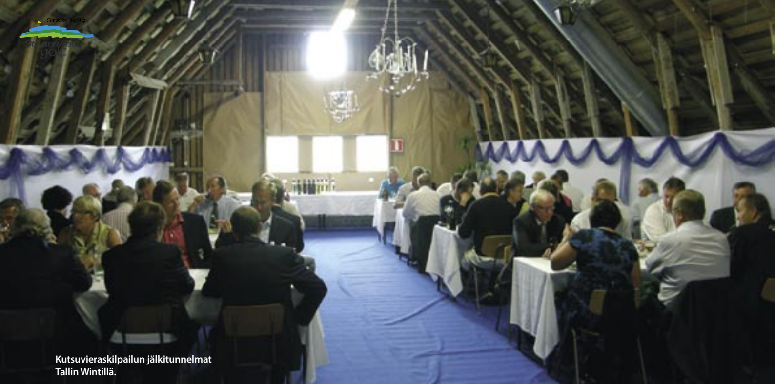
Kutsuvieraskilpailun jälkitunnelmat Tallin Wintillä.