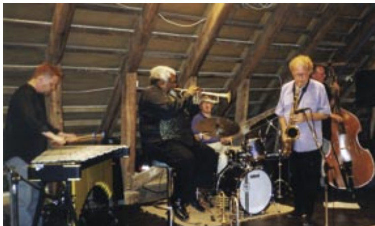
Jazzia on soiteltu Tallin Wintillä ja sitä muistellaan vieläkin kaiholla.