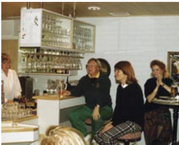
Alkuperäistä Klubin baarin tunnelmaa -90 luvun alkupuolelta.