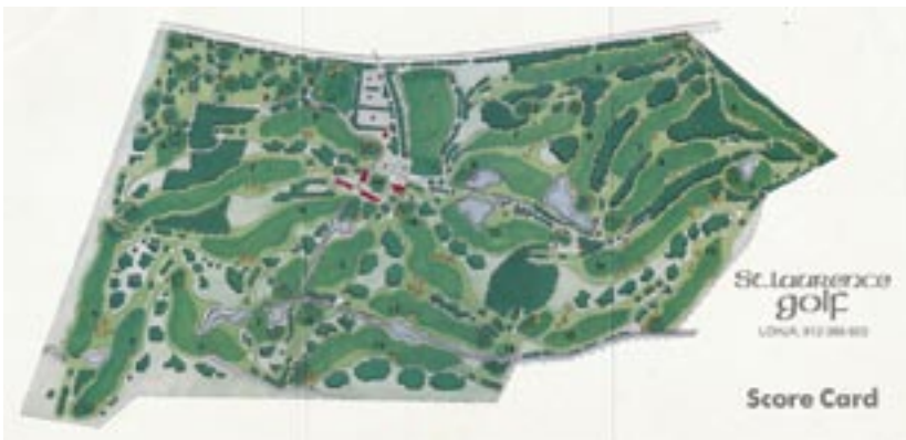
Tuloskortti mallia 1997, jolloin meillä oli kolme 9 reiän lenkkiä