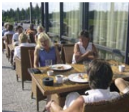
Golf Pirkkalan pelireissu tehtiin helteisenä heinäkuunäpäivänä. Vaativa kumpuileva kenttä ei kuitenkaan näkynyt tulostasossa.