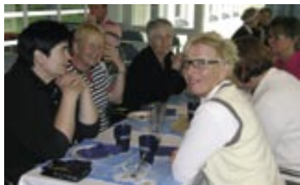
Optikko Nyman Synsam Open -kisan hyvää tunnelmaa ei pilannut edes huono sää.