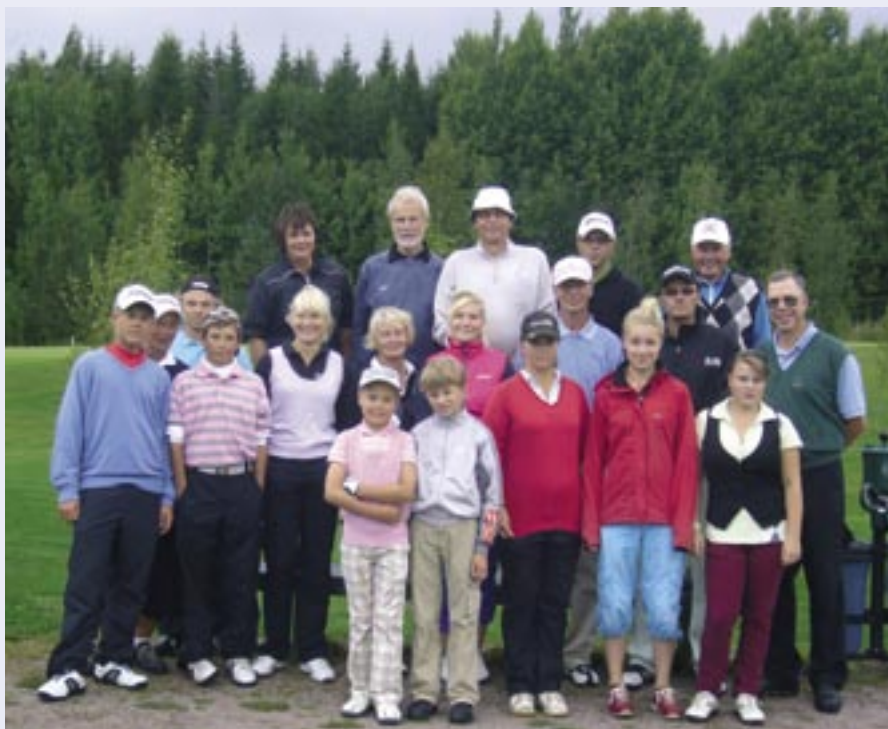
Junnut järjestivät syyskuussa toimikunnille lähipelikisan.