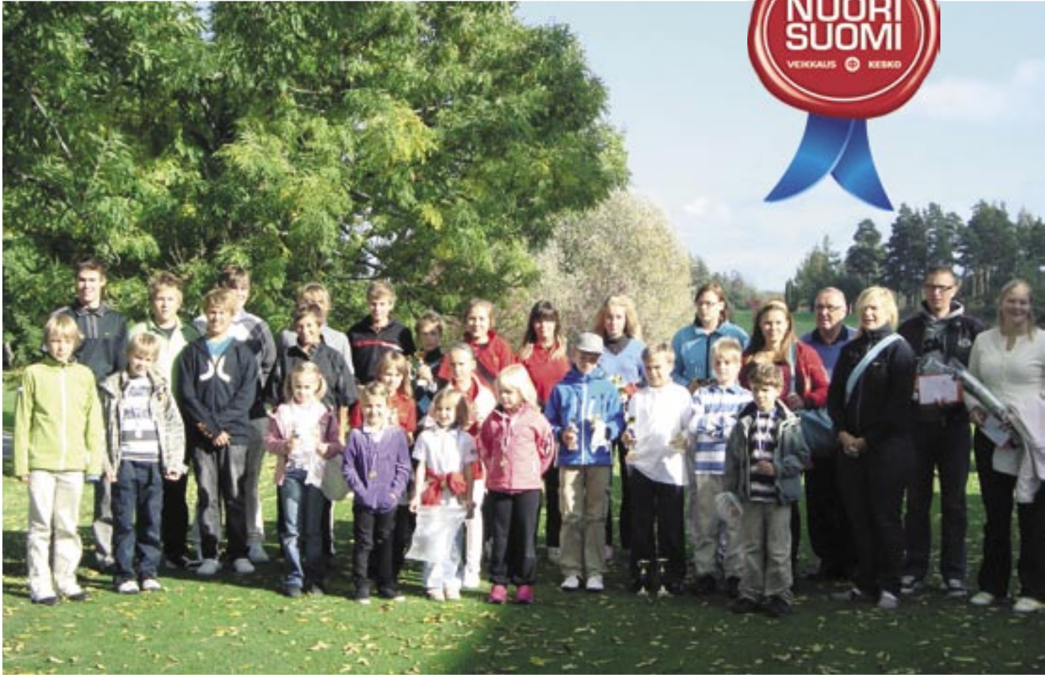
Junnujen iloisia ilmeitä päättäjien jälkeen -takana jälleen hieno kausi!