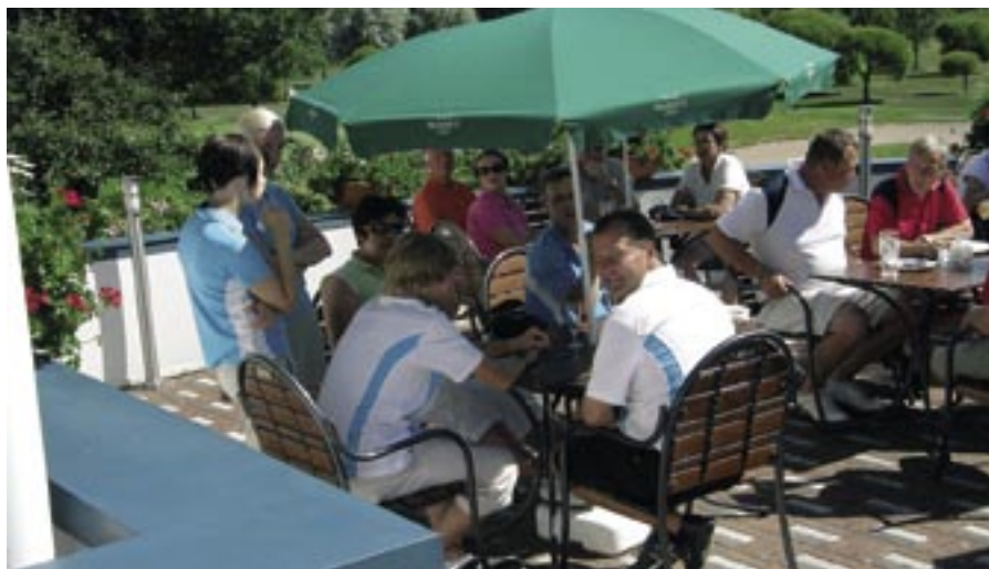
Perhepokaali on takuuvarma Klubin henkeä nostattava kisa. Tämä kuva kesältä 2008 - ensi kesänä pelataan jälleen, suunnitelmien mukaan heti Finnish Tourin jälkeen viimeisen päälle viritetyillä griineillä!

Navettarakennuksen 20 vuotta vanha peltikatto vuotaa ja tarvitsee uudistamisen. Samalla kun se uusitaan, tulee mahdolliseksi suhteel-