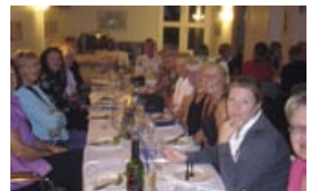
Naisten kauden päättäjäsissä palkittiin kauden parhaat ja syötiin hyvin.