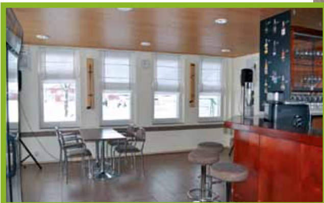
Klubin yleisiä tiloja sisustetaan kevään aikana viihtyisimmiksi. Ravintolan perälle tulee klubitila sohvineen ja televisioineen. Aulaan tulee myös uudistuksia.