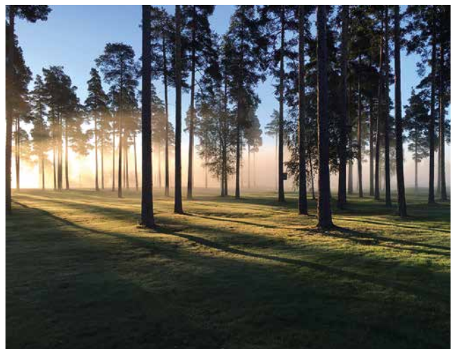
Kuva Juha Vallivaaran utuinen kuva Pyhä Laurilta.