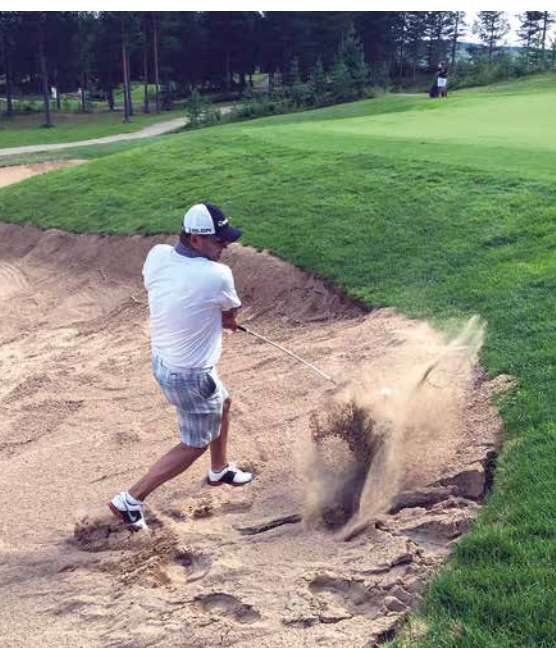
Kuva: Ja lähti!