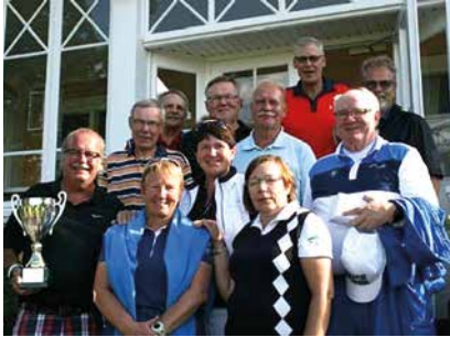
Kuva StLG:n seniorit voittivat neljän klubin (StLG, PGC, KuG ja MGC) seuraottelun Masterissa.