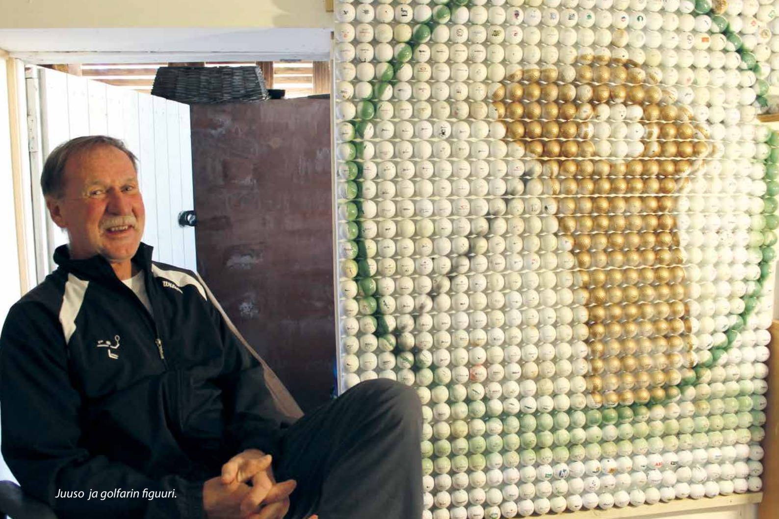
Juuso ja golfarin figuuri.