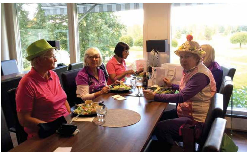
Kuva Naisten peli-illassa oli muun muassa hauskin hattu kisa.