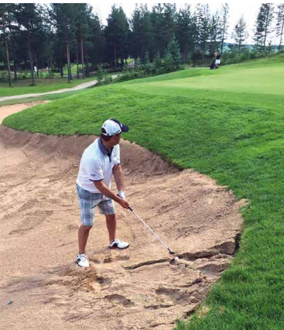
Kuva: olisihan tuosta saanut dropin, mutta oli kiva kokeilla.