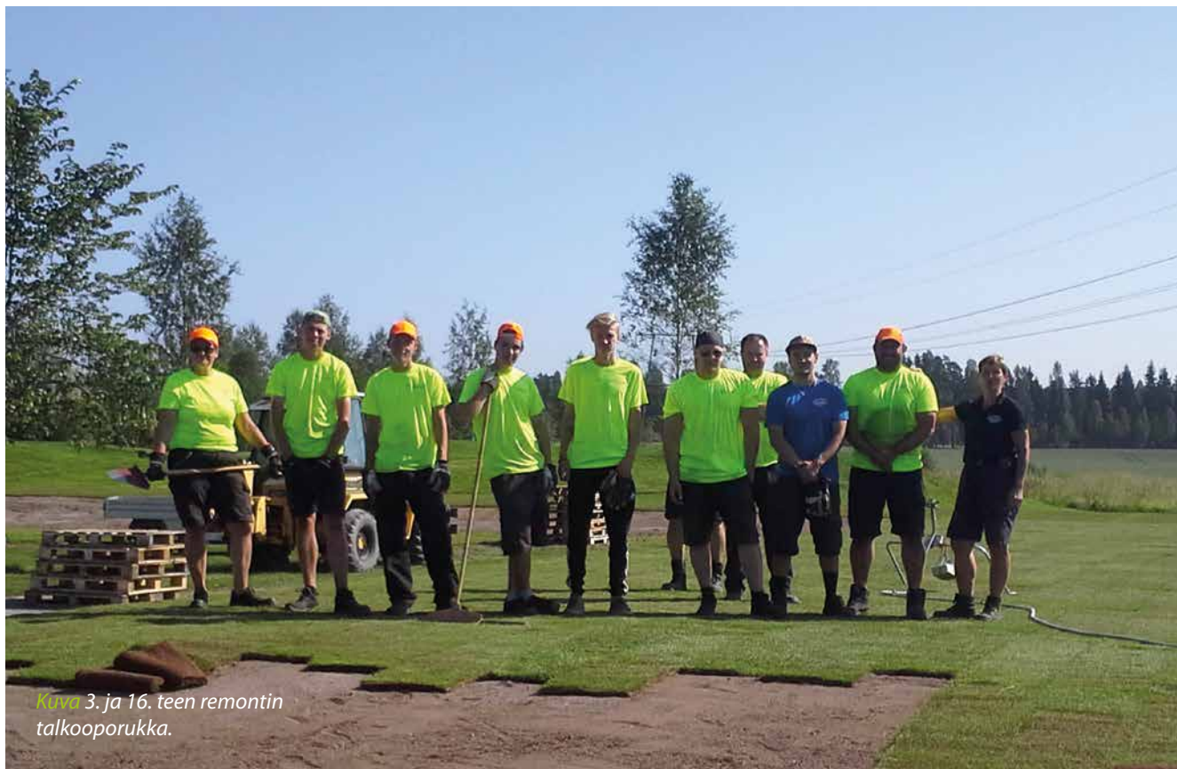
Kuva 3. ja 16. teen remontin talkooporukka.