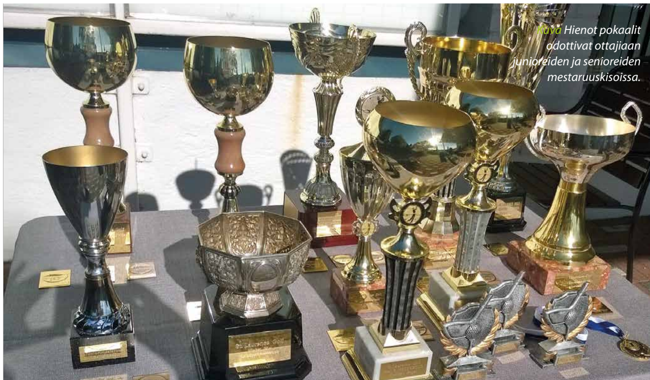
Juha Hienot pokaalit odottivat ottajiaan junioreiden ja senioreiden mestaruuskisoissa.