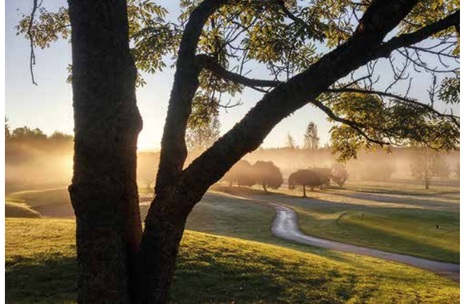
Kuva Matti Vatasen kuvassa on aamuaurinkoa ja usvaa.