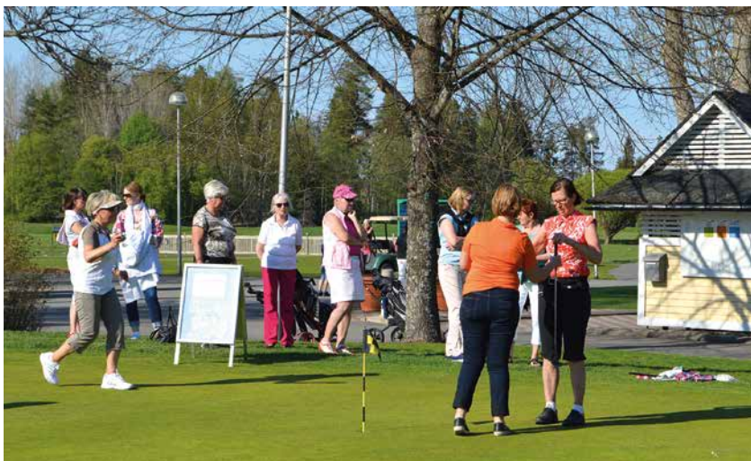
Kuva Naisten kauden avajaisissa kisailtiin aluksi puttigriinillä.