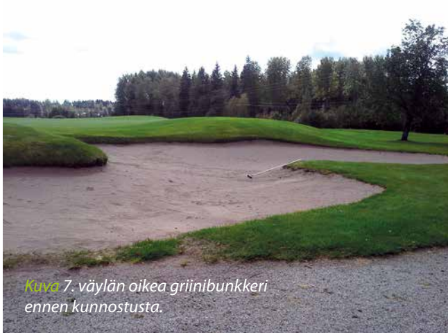
Kuva 7. väylän oikea griinibunkkeri ennen kunnostusta.