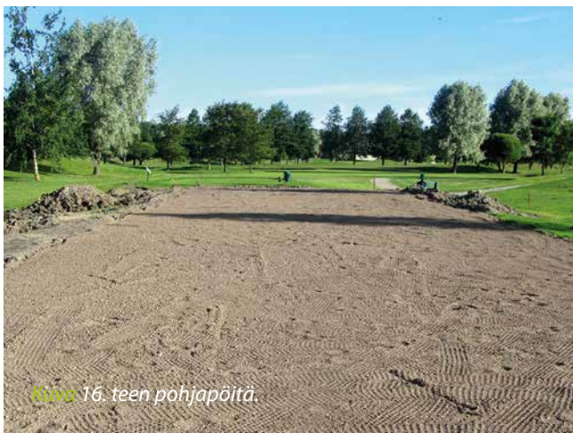
Kuva 16. teen pohjapöytä.