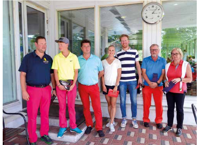
Kuva Elokuussa pelattiin naisille ammatteja Naisten Pankki Open Scramblessa.