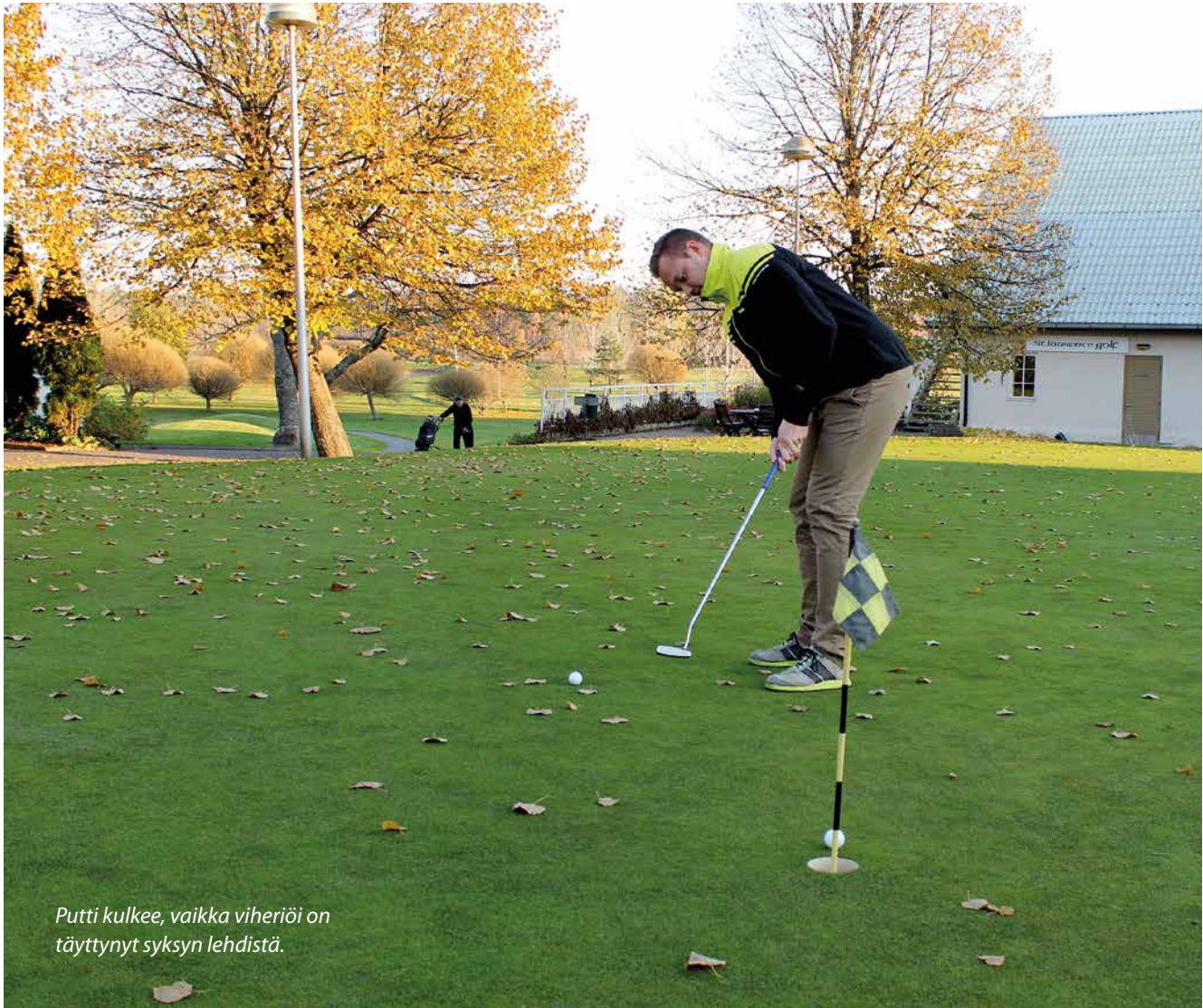
Putti kulkee, vaikka viheriö on täyttynyt syksyn lehdistä.