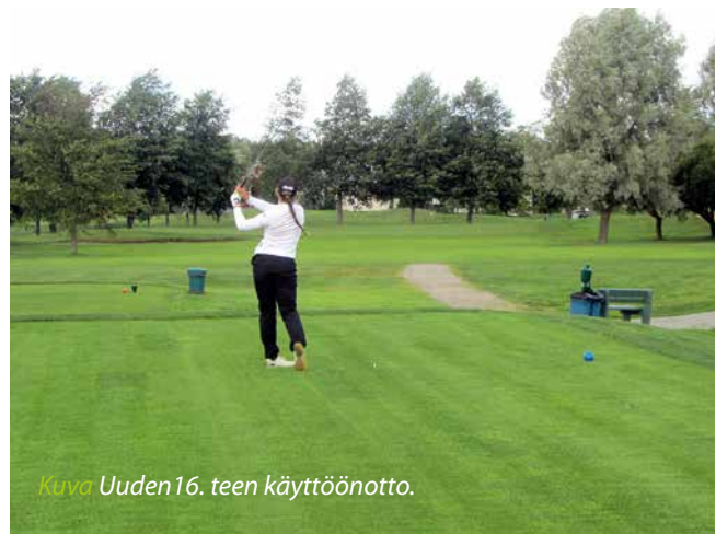
Kuva Uuden 16. teen käyttöönotto.

ranevan. Uusi oma siirtonurmi on rönsyrölliä.