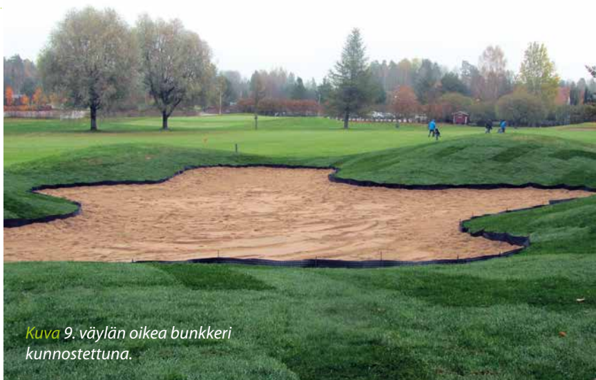
Kuva 9. väylän oikea bunker kunnostettuna.

Vanha nurmi oli rönsyröllin ja kylänurmikan sekoitusta, mutta rönsyröllin on se toivottava nurmilaji. Kylänurmikka on 'rikakasvi' joka leviää ympäristöstä viheriölle, kun olosuhteet ovat sille suotuisat. Nurmen vaihdolla ja kasvualustan maanparannuksella toivotaan nurmen laadun pa-