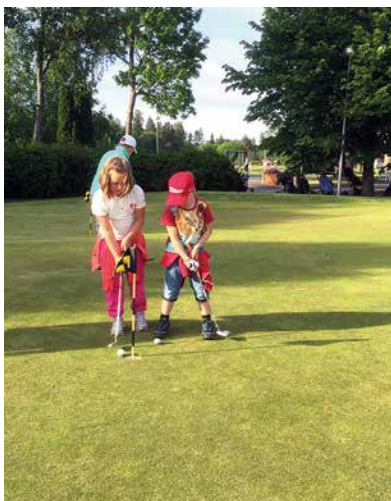
Kuva Puttiharjoituksia keskiviikon kesäharkoissa.