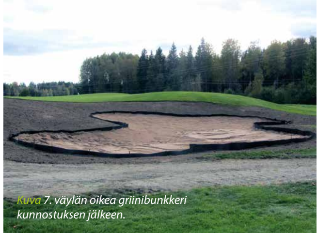
Kuva 7. väylän oikea griinibunkkeri kunnostuksen jälkeen.