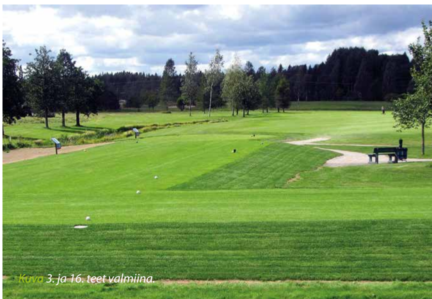
Kuva 3. ja 16. teet valmiina.