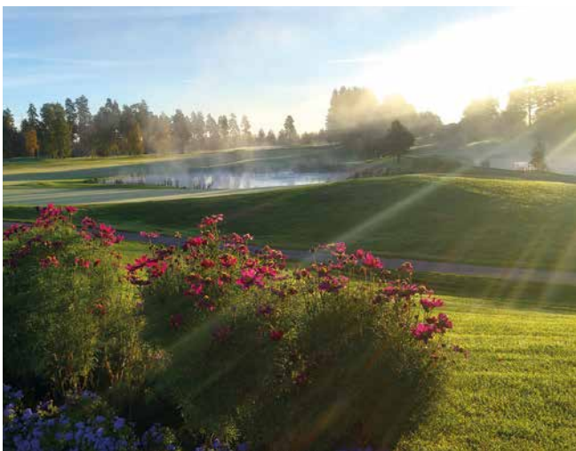
Kuva Markku Saarisen kuvassa auringon säteet kultaavat kukat.