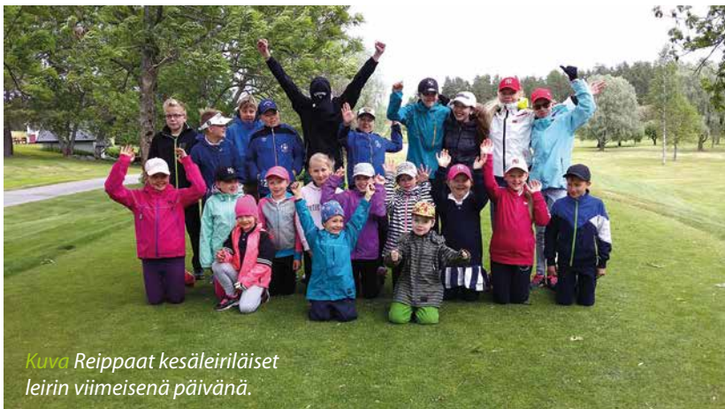
Kuva Reippaat kesäleiriläiset leirin viimeisenä päivänä.