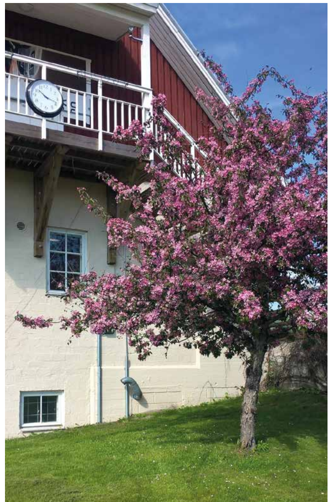
Kuva Viveka Tverin kuvasi Kalkki-Petterin "sakuran".