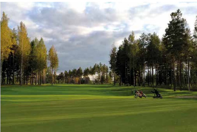
Kuva Asko Ryhäsen kuvassa Pyhä Laurin väylä 16. viheriöltä kuvattuna.