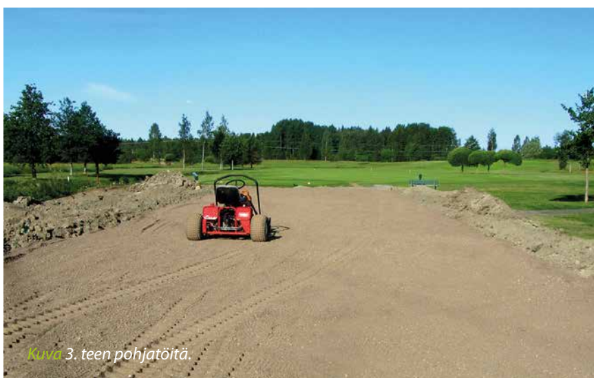
Kuva 3. teen pohjatöitä.