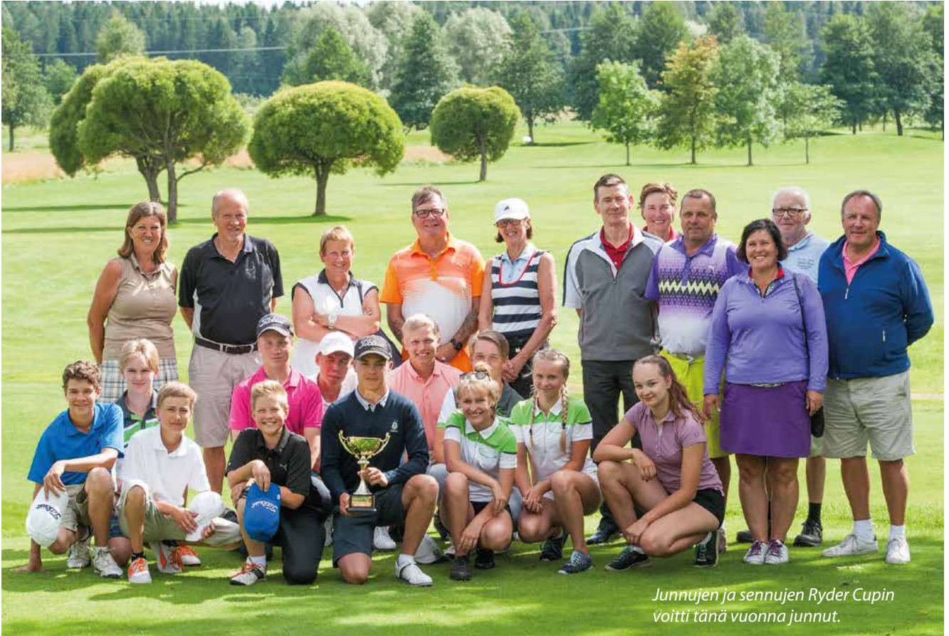
Junnujen ja sennujen Ryder Cupin voitti tänä vuonna junnut.