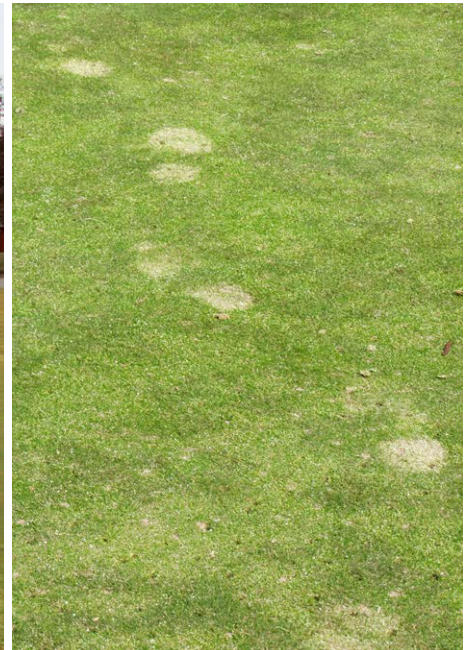
Kuva Selviä kävelyjälkiä on tullut talven aikana kolmelle greenille. Ne syntyvät, kun jäisellä nurmella liikutaan eli joku satunnainen lenkkeilijä kävellyt lumetomilla greeneillä pakkaskelillä kentän ollessa jo suljettuna. Heinä on murskaantunut ja tallominen mahdollisesti jopa vioittanut heinän kasvupistettä. Jälki korjaantuu pikkuhiljaa uuden kasvuston kautta.

17.4. Kauden kentänhoito suunnitellaan kilpailu- ja tapahtumakalenterin ympärille. "Rajuimmat" hoitotyöt ajoitetaan siten, että pelialue ehtii kunnolla toipua ennen kauden päätapahtumia.