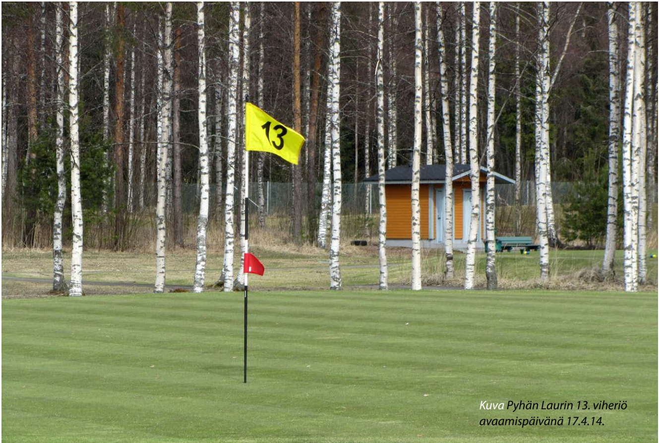
Kuva Pyhän Laurin 13. viheriö avaamispäivänä 17.4.14.

E nnen pelikautta on tehty paljon metsätöitä, hiekoitettu ja kalkittu väylät, huollettu koneita, kunnostettu kenttäkalusteita, tehty remonttia klubilla ja suursiivousta kiinteistöissä, suojattu viheriöitä jne.