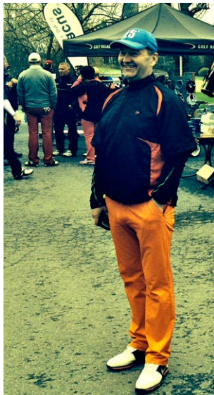
Petri Granat Golf Balance Scramblessa 10.5.