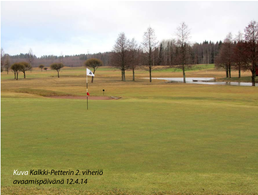
Kuva Kalkki-Petterin 2. viheriö avaamispäivänä 12.4.14