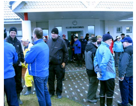
Kuva Talkooväkeä kerääntyneenä klubitalon eteen.